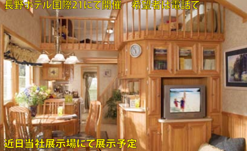
近日当社展示場にて展示予定